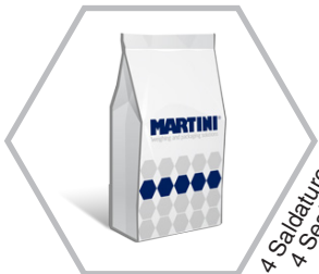
4 Saldature 4 Seals