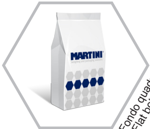
Fondo quadro Flat bottom